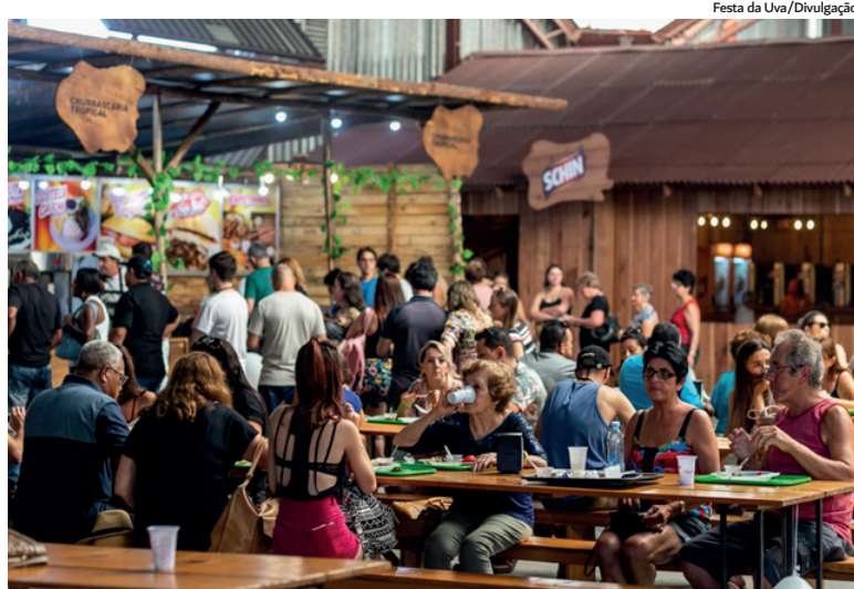
Festa da Uva/Divulgação

Para melhor organização da comercialização, há um cronograma de atendimento para expositores da parte de gastronomia, alimentação e